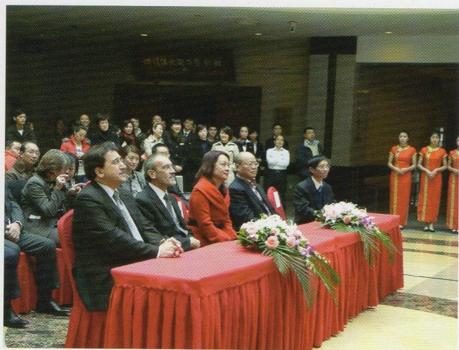
Mostra fotografica "Le piazze del Piemonte" a Pechino