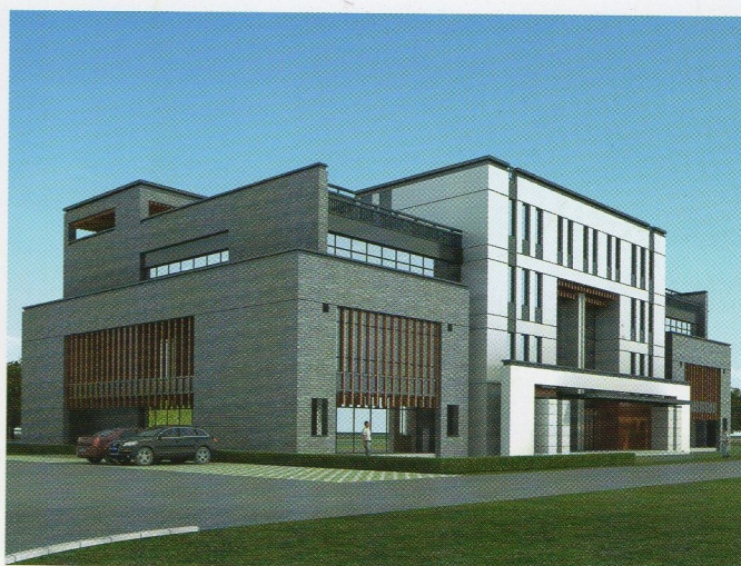
Villa con spazio espositivo