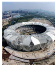
杭州奥体中心体育场