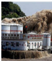
台风黄蜂擦过浙江