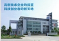
国家级科技企业孵化器