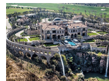
英保险大亨建南非最大