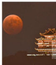
杭州现罕见红月亮