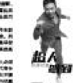
奔跑吧兄弟成员邓超

【本报杭州专稿】《奔跑吧兄弟》开播前夜，苏宁火线签约邓超。这一举动引发了网友们的广泛关注和热议。