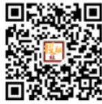
扫一扫 关注投融资社

作为一个代表国内顶尖营销水准的营销论坛，主办方处处在细节上体现“无处不营销”的概念。从年初启动的金麦奖厦门、哈尔滨、杭州、海宁、青岛宣讲会现场的种种细节，都让人惊喜：土豪茶叶蛋、大佬合影墙等趣味性活动，都引发现场观众的自发传播。而今天启动仪式上颇具人文情怀的“写给下一个五年的自己”活动，更在提醒每一位与会者：下一个五年，你，还有梦想吗？