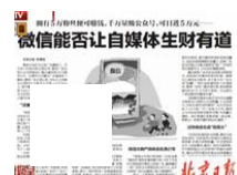
微信产业链：拥有5万粉丝便可赚钱