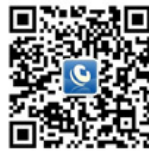
扫一扫 关注浙商网