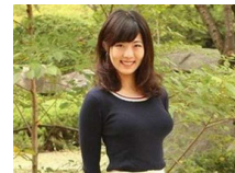
日本9所名校校花冠军