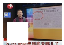
药企8.2亿赞助费到底去哪儿了